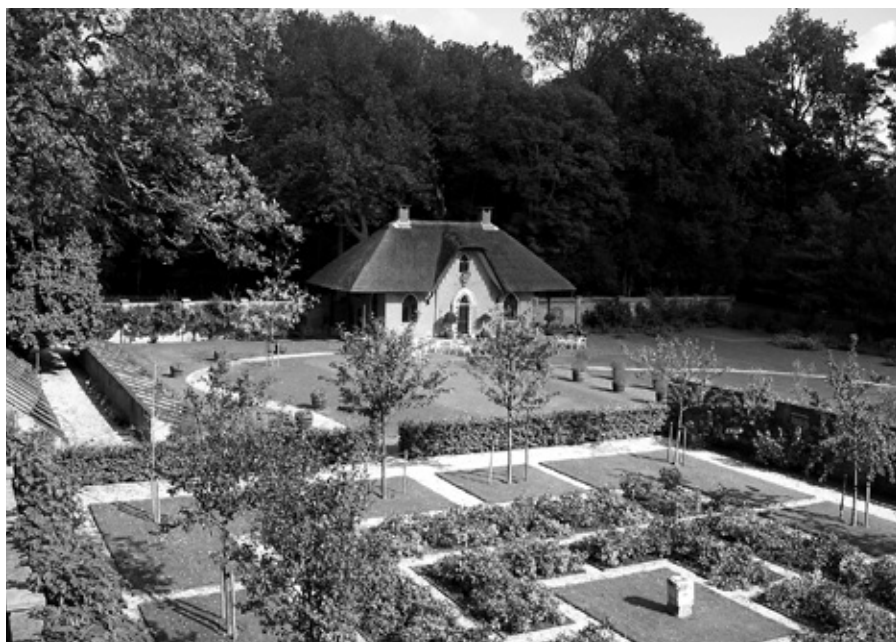
Boven het Zwitsers Speelhuis in de ommuurde tuin, onder het Koetshuis.