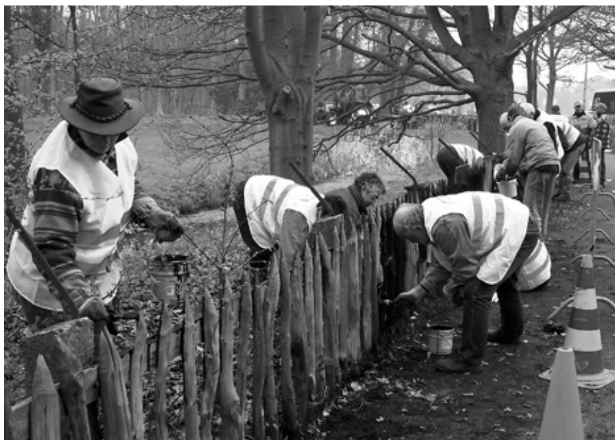
Vrijwilligers aan het werk: in het bos, in de ommuurde tuin en op een landgoedfair.