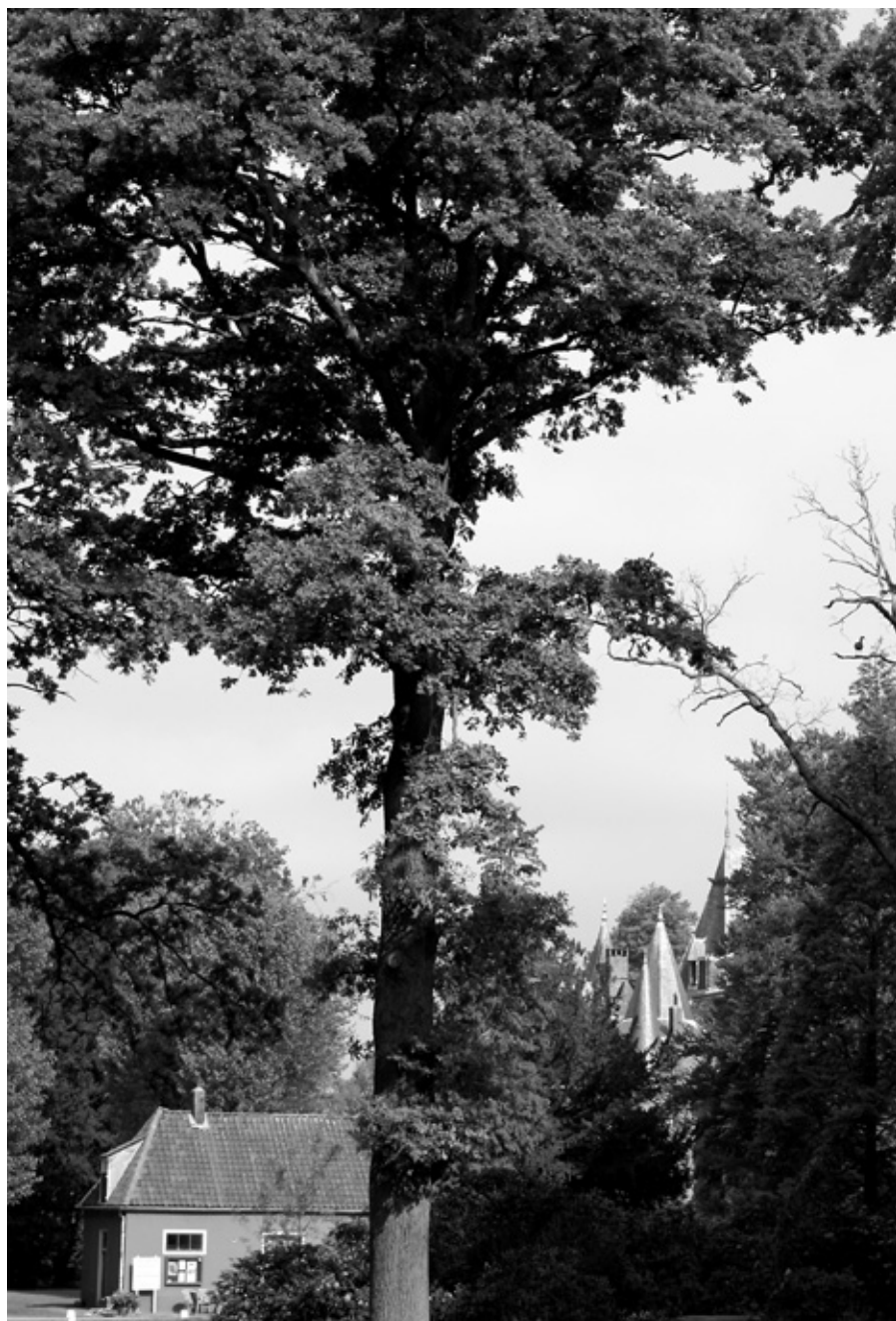
Het washuis met op de achtergrond het kasteel.