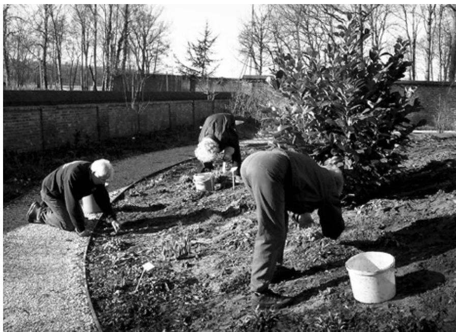
Vrijwilligers aan het werk in het buitengebied en tijdens een Kastelendag.